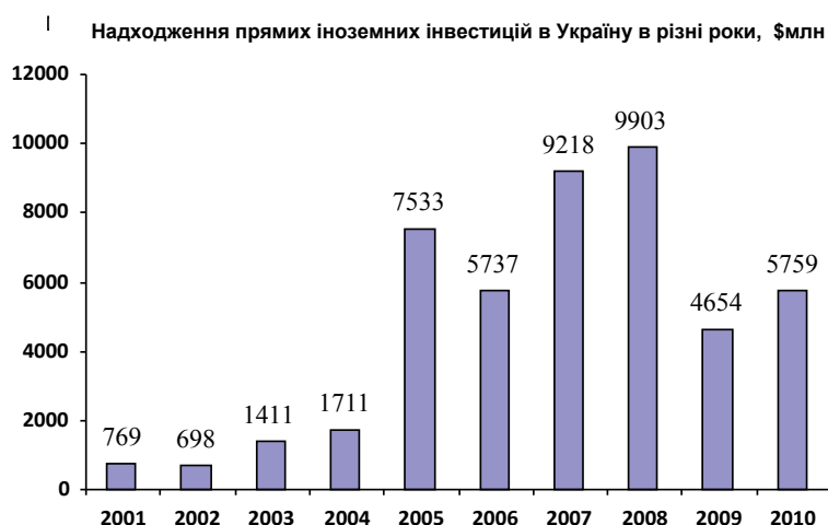
Рис. 3. Надходження прямих іноземних інвестицій в Україну, в різні роки [6, с. 20]

Зрозуміло, що не лише це агентство займалось залученням інвестицій в Україну, і на сьогодні після його ліквідації його функції перейшли на інші міністерства та відомства, але цікаво, що в той період, коли агентство функціонувало, і можливо також впливали інші політичні чинники, в Україні був помітний рух до збільшення інвестування в економіку країни. Це можна побачити на графіку, який був підготовлений на основі даних Міністерства статистики України фахівцями проекту «Інвестиційний клімат в Україні» організацією Групи Світового Банку Міжнародною фінансовою корпорацією, що також був створений з метою допомоги Україні в поліпшенні інвестиційного клімату.