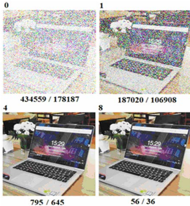
Рис. 2. Результати передавання зображення

програє методу PL-log-БГЦ, маючи меншу обчислювальну складність декодування даних. На великих значеннях E_b/N_0 > 2 дБ значення BER не дуже сильно залежить від коригувальної функції. Відповідно величина BER для БГЦ декодера прямує до BER методу Робертсона, досягаючи «порогу насичення».